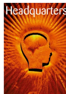
Headquarters Brosjyre om sammenslåingen i 2002/2003.

Driften av Forny, TEFT, IRC Norway og prosjektet Eksportrettet forretningsutvikling har gått etter planene.